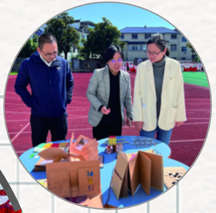
石室乡第八届校园围棋体育节开幕